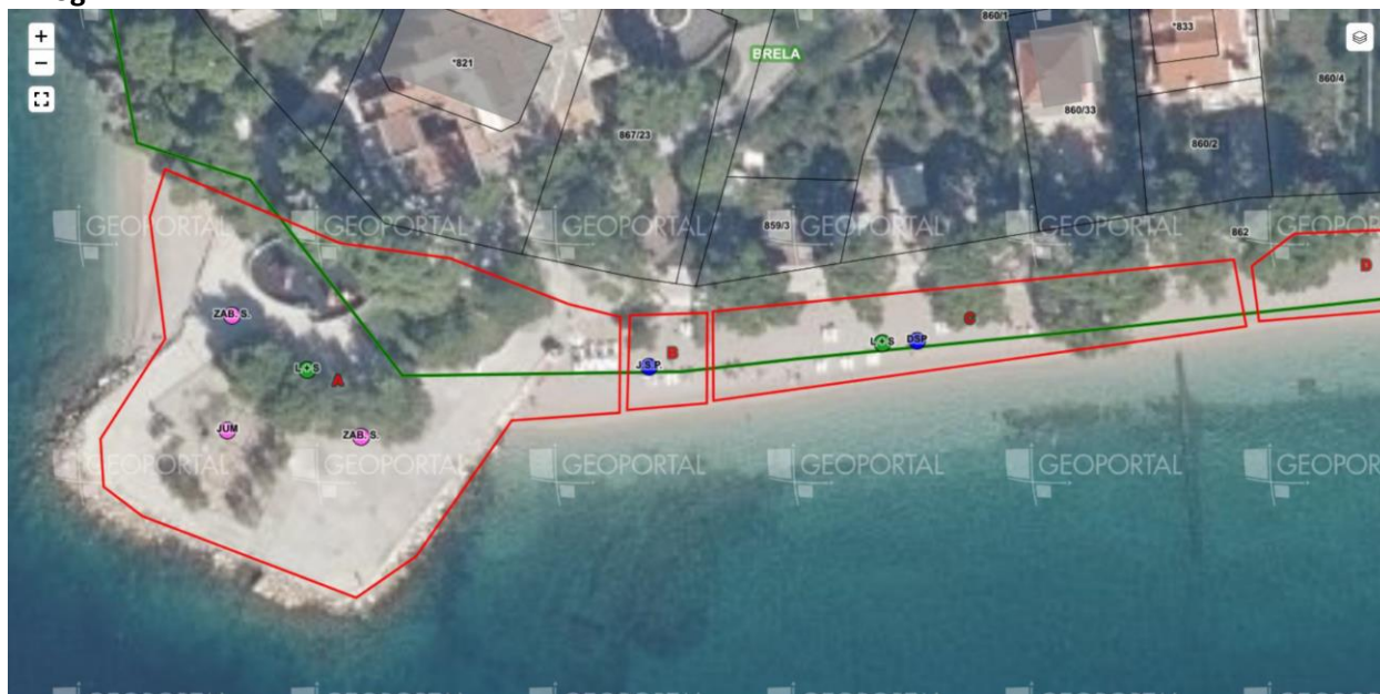
Plato i plaža Soline ID1