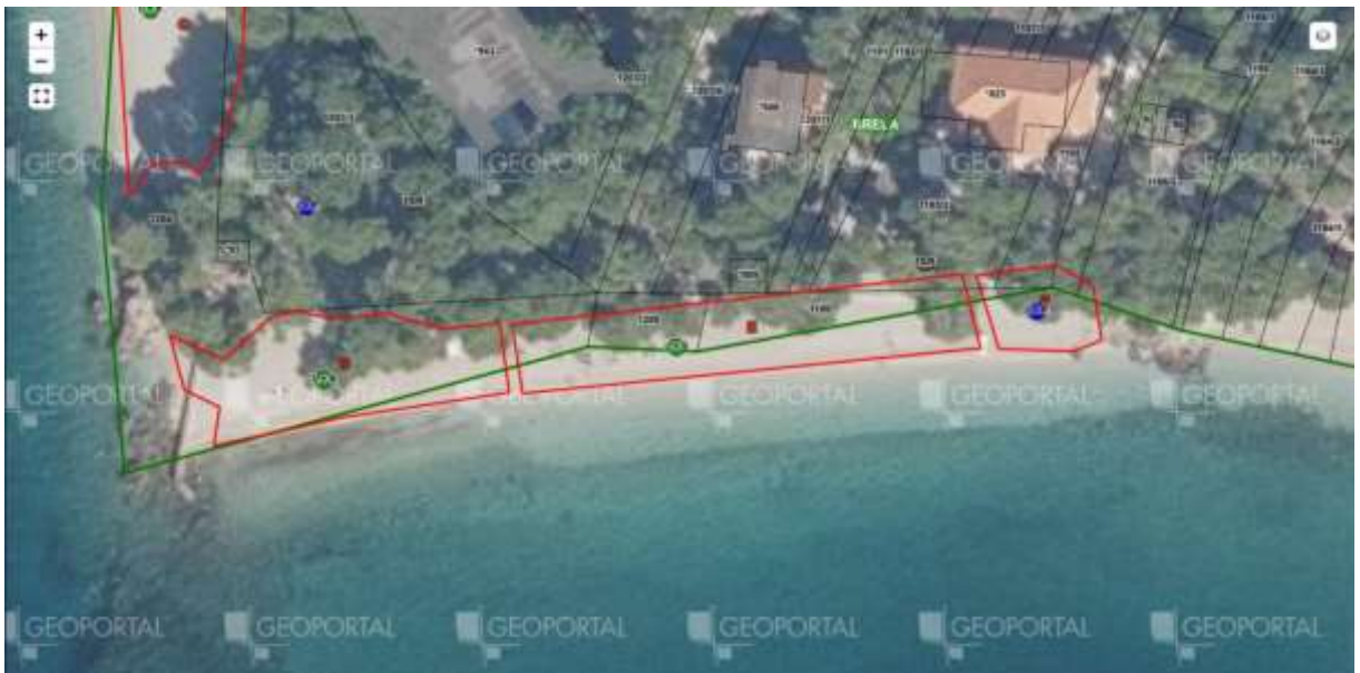
Plaža Punta Rata