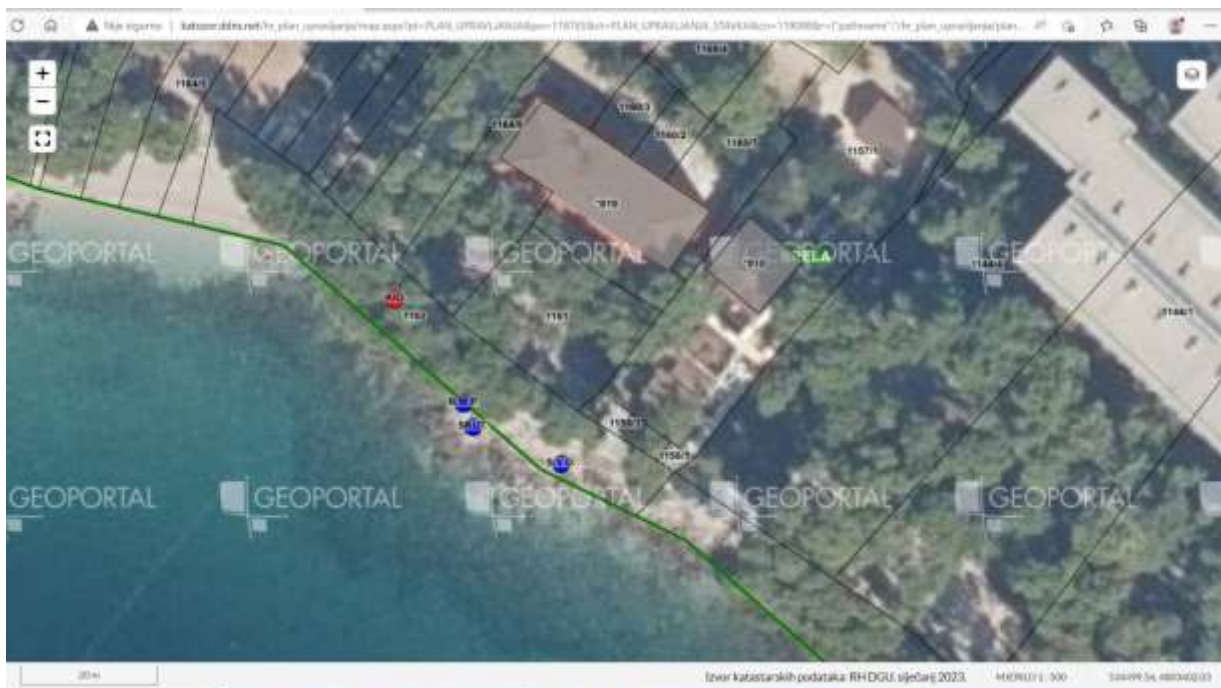
Ispred Hotela Brela