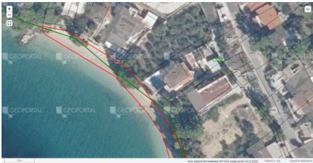
Plaža Berulia – Loznica