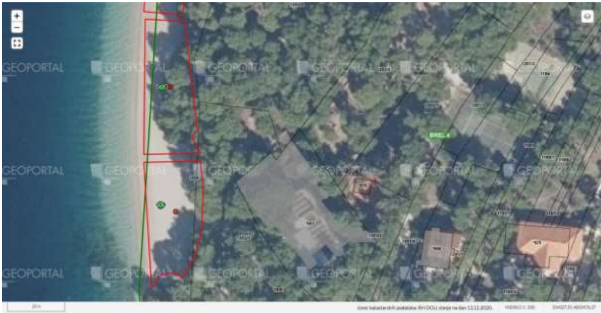
Plaža Punta Rata