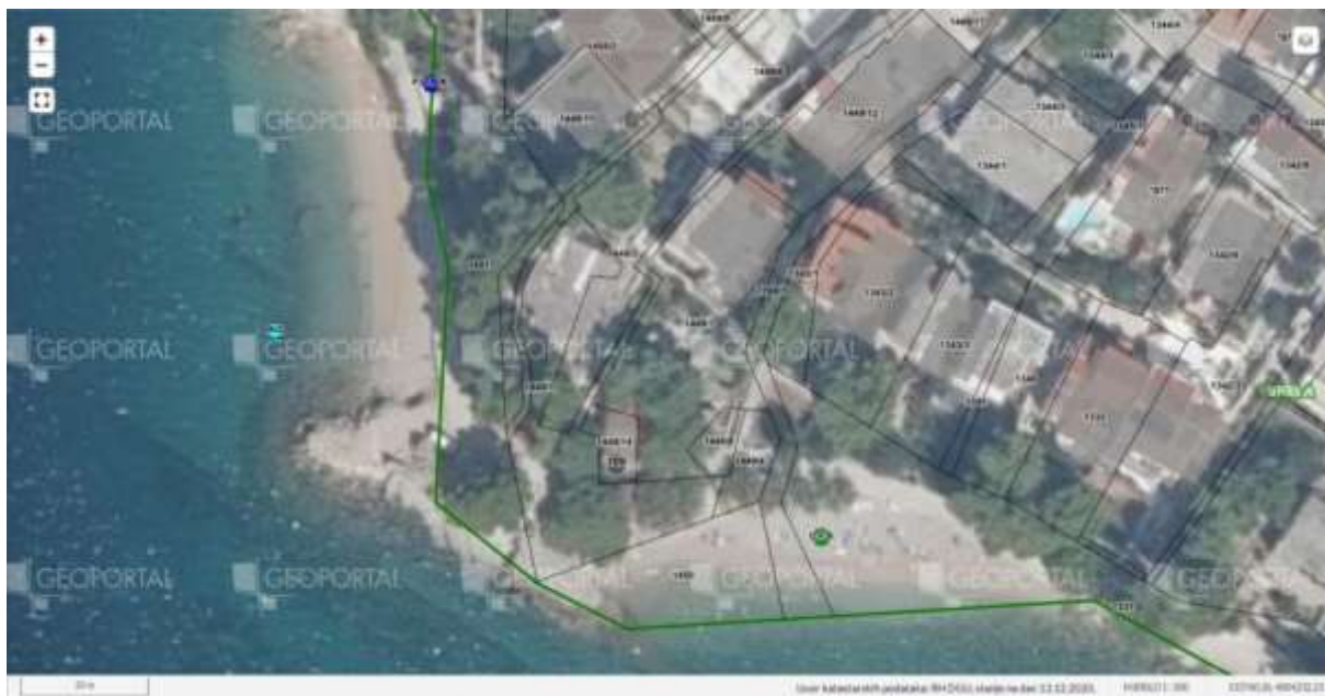
Plaža Šćit – mali Šćit