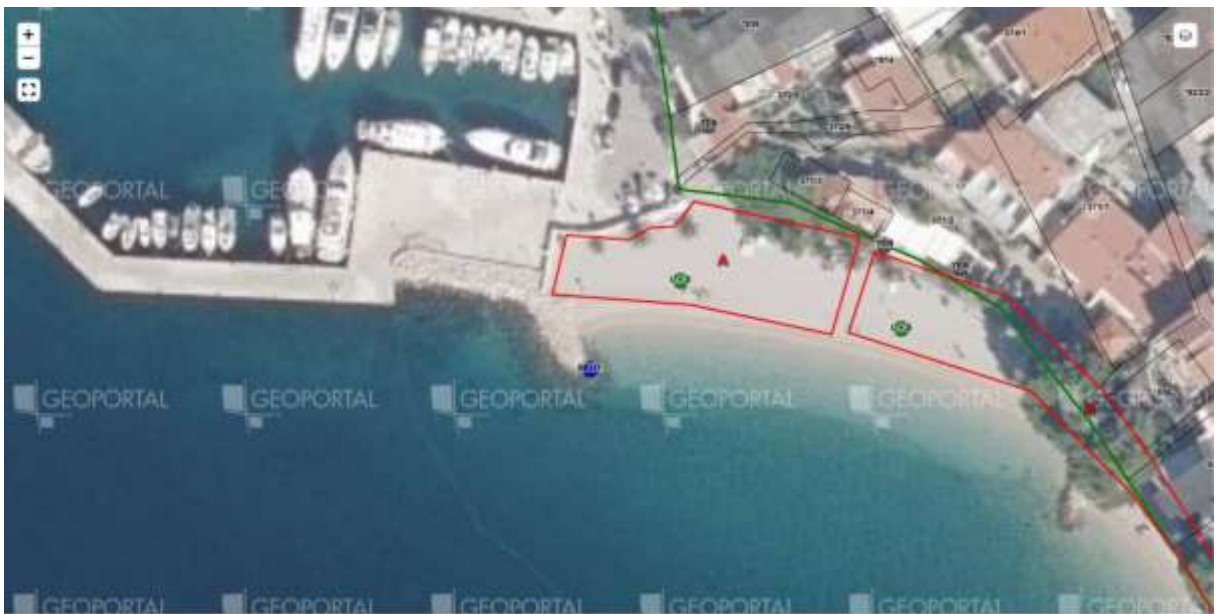
Plaža Za puntom