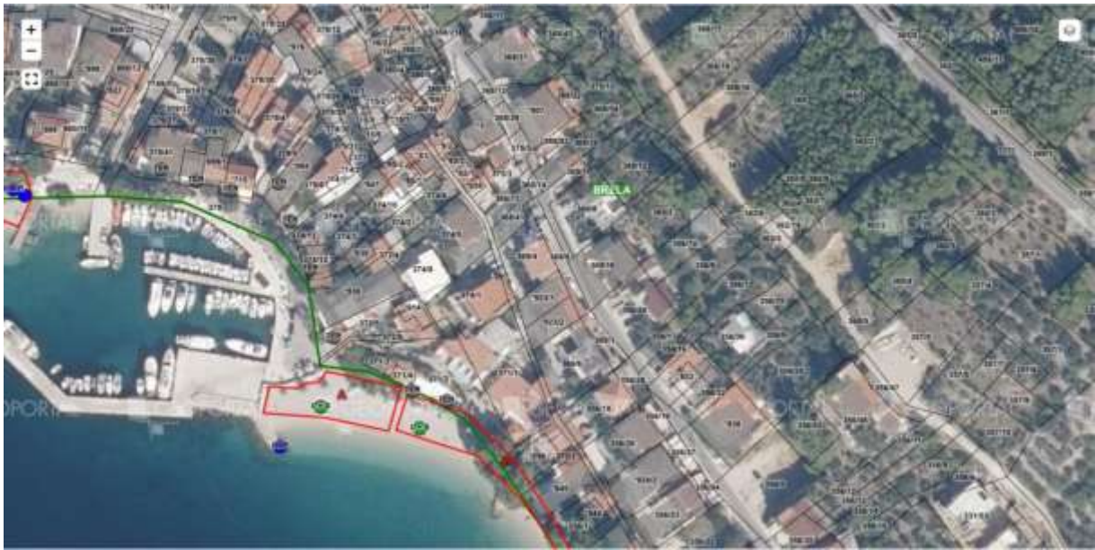
Plaža Za puntom