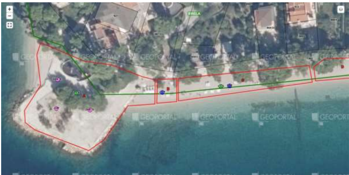
Plato i plaža Soline