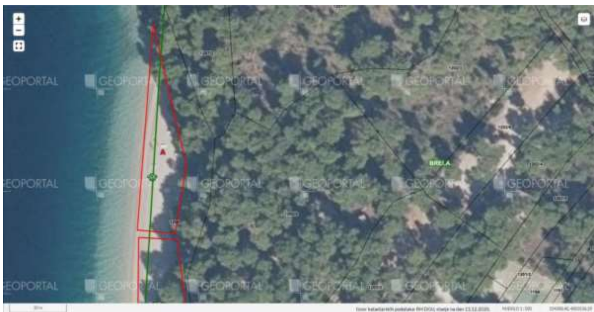
Plaža Punta Rata